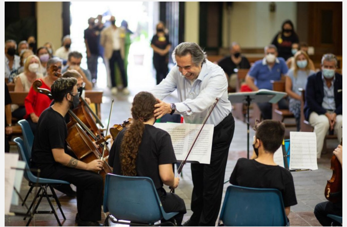
Il Maestro Muti con i giovani orchestrali a Scampia.